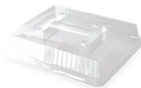
4 COUV PR 5 C GM