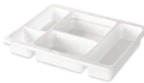
3 PR 5 C GM