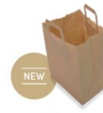
10 KB 26 x 17 x 25 BRUN