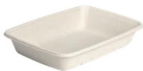
4 RFN 810