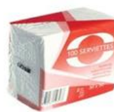
3 SERV 30 X 30 BL 2F