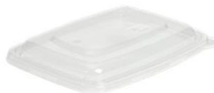
5 COUV RFN