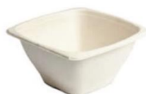
2 SCN 960