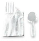
7 KIT 4/1 PRESTIGE