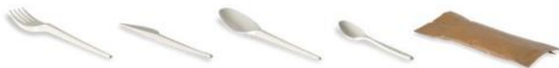
1 FO 175 PLA