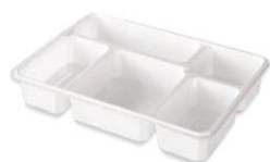
1 PR 5 C ECO