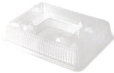
2 COUV PR 5 ECO